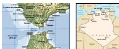
mapa Gibraltaru a Alžíru

Podobný scénář se opakoval po přeletu do Alžíru , kde strávil několik příštích dní. V Berlíně uvažovali: jestliže se Montgomery prochází po Africe , zítra k útoku na Lamanšském průlivu jistě nedojde. Všichni nacističtí agenti dostali příkaz: „ Za každou cenu zjistit, co to je Plán 303. “