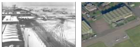
letiště Northold (za 2. světové války a dnes)

Dne 25. května 1944 projel Rolls-Roysem s vlajkou generála Montgomeryho na předním blatníku ulicemi Londýna na letiště Northold . Na tváři vykouzlil typický úsměv a pověstným způsobem salutoval. Poté odletěl soukromým Churchillovým letadlem do Gibraltaru .